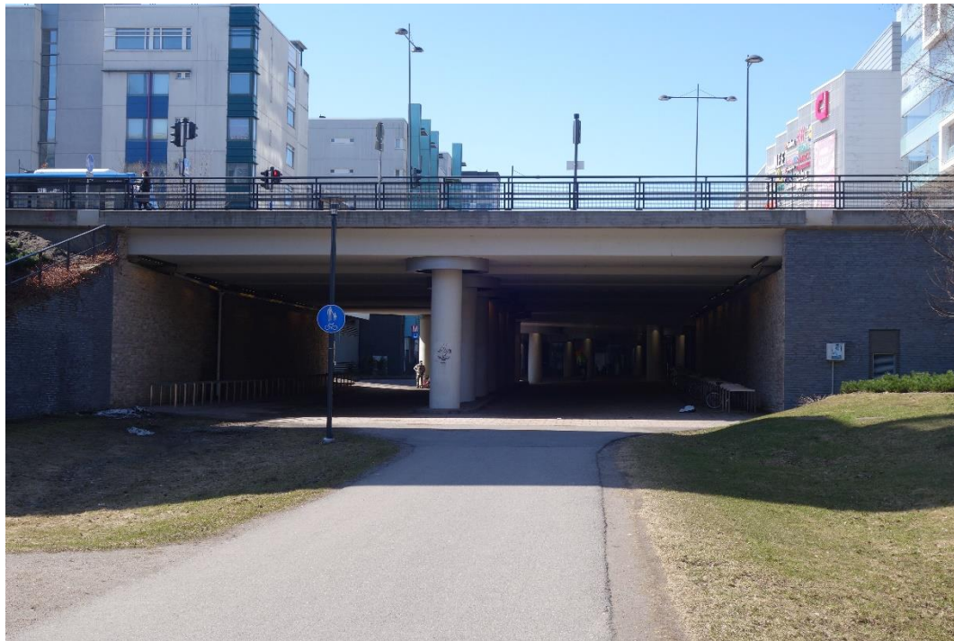
Näkymä Matinniityltä Metroon päin